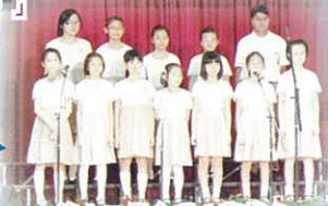
第十三屆全港小學英文民歌組合歌唱比賽