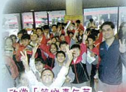
欣賞「管樂嘉年華」管樂音樂會