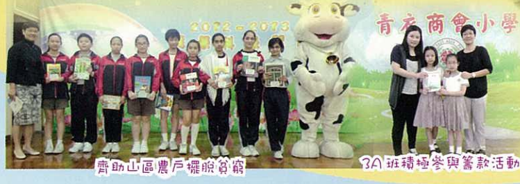
齊助山區農戶擺脫貧窮

今年，學校與三間位於美國及克羅地亞小學進行書籤交流，也參與國際小日牛香港分行舉辦的「開卷助人」閱讀籌款計劃。此外，為與全校同學一起分享故事，同學在早會時段參與了「Fun Fun Story Time」。