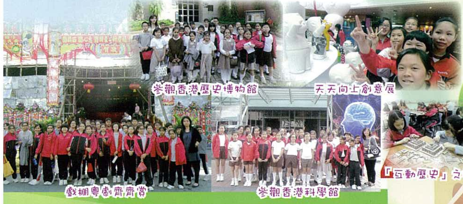
參觀香港歷史博物館

本校舉辦不同的戶外學習活動，為學生提供課室以外的全方位學習經歷，透過實地考察及參觀，綜合跨學習領域的知識、技能和價值觀。