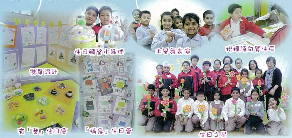
生日願望水晶球 土風舞表演 祝福語句賀生辰 餐單設計 有「營」生日會 「搞鬼」生日會 生日之星