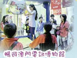
暢遊澳門電訊博物館