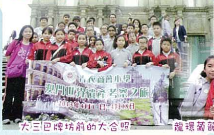
大三巴牌坊前的大合照