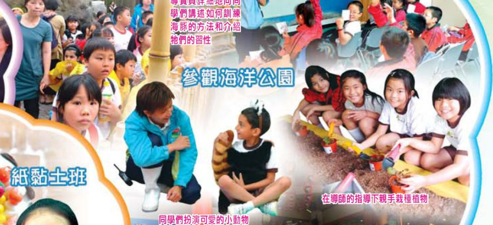
在導師的指導下親手栽種植物