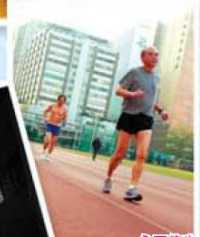
永不停步