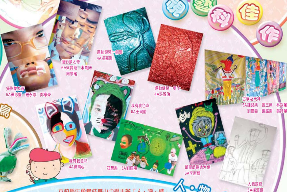
攝影家太奇 運動健兒一劍擊 4A馮嘉琪 攝影家太奇 運動健兒一勇士 4A許瀚治 5A譚志堅 鍾永意 鄭家豪 我有我色彩 6A王琬蔚 狂想樂 3A劉逸翔 萬聖節歡樂大使 6A李新博 古埃及天神 5A鍾銘樂 曾玉婷 林鈺瑩 劉偉雯 鍾銘樂 吳詩華 人物速寫 5A楊濠鏡

本校學生勇奪桂華山中學主辦「人·物·情」攝影文學創作比賽小學組攝影新詩冠、亞軍。