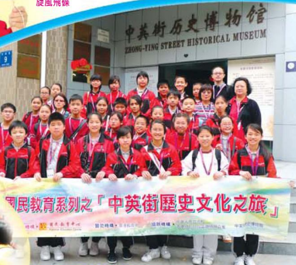
國民教育系列之「中英街歷史文化之旅」