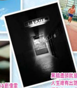
黑暗盡頭就是光明， 人生總有出路