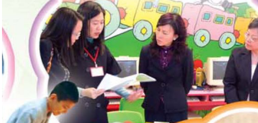
教育局副秘書長到訪了解學生學習情況，對本校照顧個別差異的措施大為欣賞。