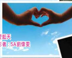
我愛藍天