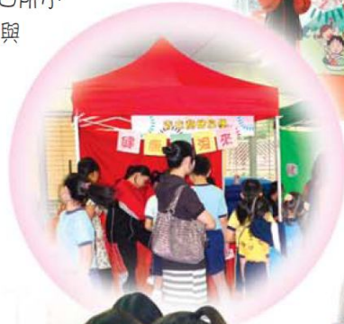
親子烹4缸比賽評判試食