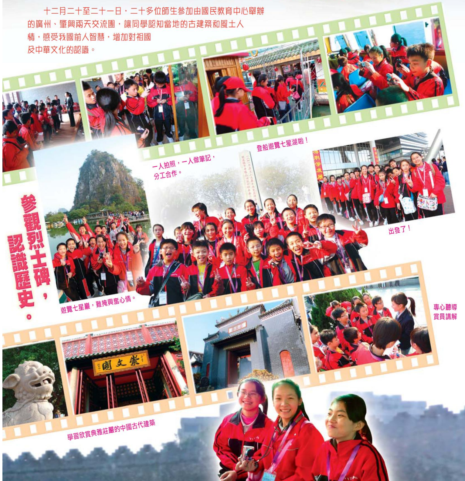
登船遊覽七星湖啦！

十二月二十至二十一日，二十多位師生參加由國民教育中心舉辦的廣州、肇興兩天交流團，讓同學認知當地的古建築和風土人情，感受我國前人智慧，增加對祖國及中華文化的認識。