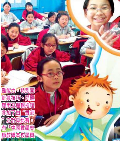
難能力，特別開計算技巧、問題應用及邏輯推理參加了由「香港」之計算比賽，有「中國數學奧師教導本校學員