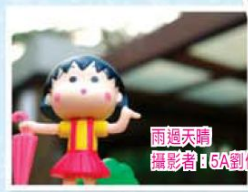
雨過天晴 攝影者：5A劉偉雯