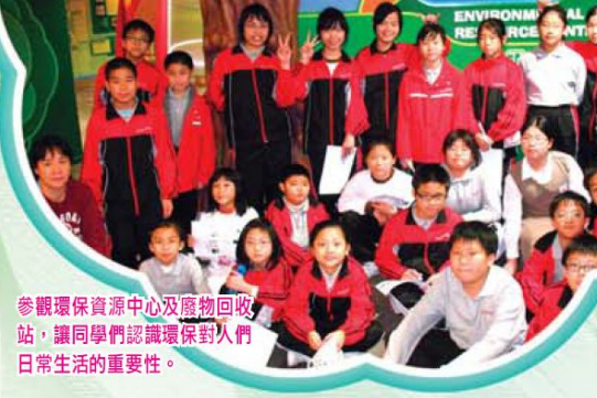
參觀環保資源中心及廢物回收站，讓同學們認識環保對人們日常生活的重要性。