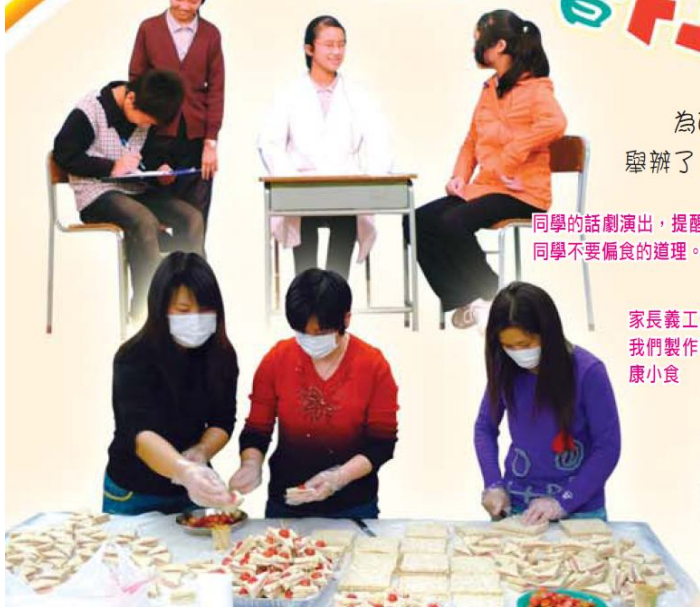
家長義工為我們製作健康小食