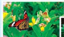
活得精彩

人在我身旁跑 花在我身旁飄 從小 我每天都在問 為什麼我是我 可是……沒有人回答我…… 我開始茁壯成長 靠自己尋找答案 迎向那燦爛的陽光 直到現在……我才知道 因為有你、我、他 於是有一不一樣的我